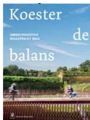
De huidige omgevingsvisie 2040