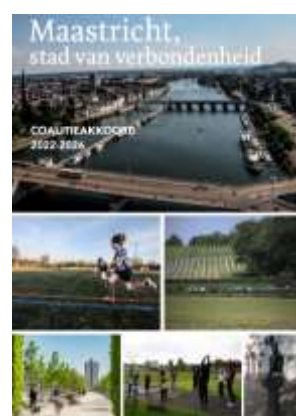
Coalitieakkoord 2022 - 2026

Tijdens de participatieve momenten (zie hoofdstuk 4 voor de planning) en vooraf aan het burgerberaad zullen de kaders ook worden meegegeven. Daarbij kunnen zoals eerder gesteld eventuele uitwerkingen en reacties daarop resulteren in andere uitwerkingen. Bij het meebeslissen, lees bij het burgerberaad, zullen de bestaande kaders aan het begin van het proces worden aangegeven.